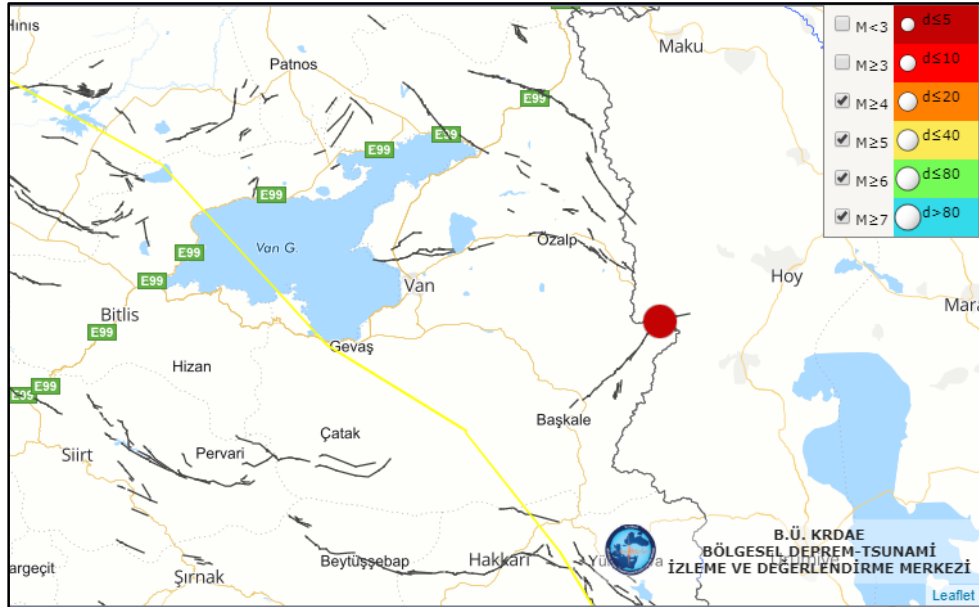
Kaşkol-Başkale-Van ( M_l=4.7 ) depreminin lokasyon haritası

16 Şubat 2020 tarihinde Kaşkol-Başkale-Van merkez üstünde yerel saat ile 21:02'de aletsel büyüklüğü M_l=4.7 olan orta şiddette bir deprem meydana gelmiştir. Deprem odak derinliği yaklaşık 3 km civarında olup sığ odaklı bir depremdir. Deprem Van ili ve ilçelerinde hissedilmiştir.