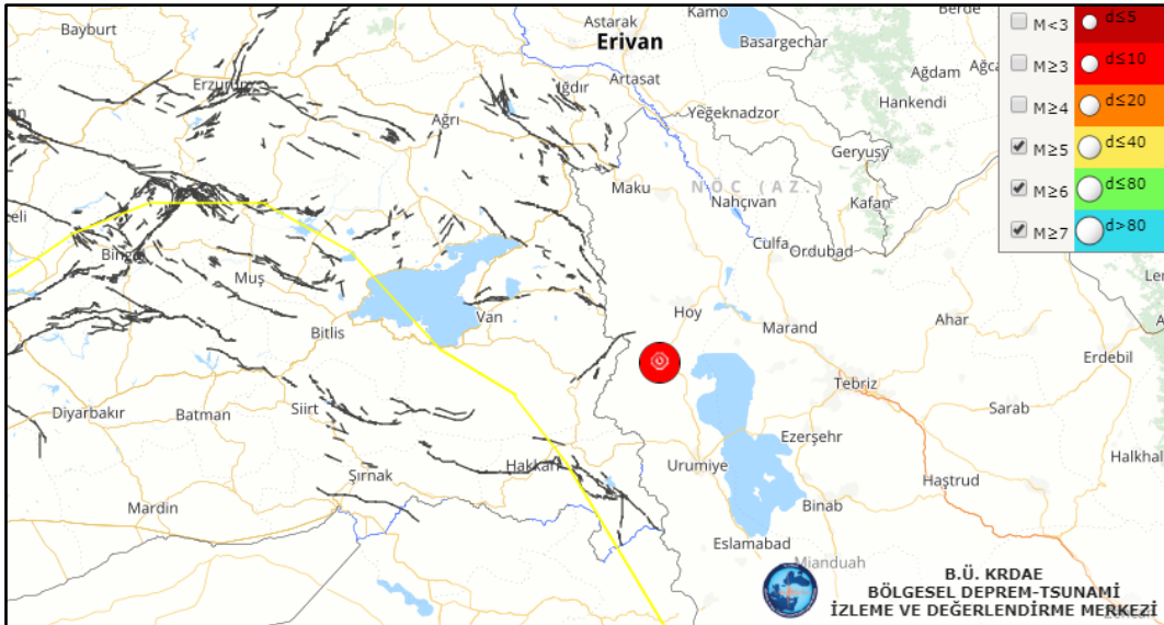
Türkiye-İran Sınır Bölgesi Depremi ( M_l=5.8 )

23 Şubat 2020 tarihinde Başkale-Van'a yaklaşık 60 km uzaklıkta Türkiye-İran sınırında yerel saat ile 08:53'de aletsel büyüklüğü M_l=5.8 olan şiddetlice bir deprem meydana gelmiştir. Deprem odak derinliği yaklaşık 8 km civarında olup sığ odaklı bir depremdir. Deprem Van ili ve ilçeleri ile Hakkari'de hissedilmiştir. Deprem dışmerkezi İran'ın Hoy Kentine yaklaşık 40 km. uzaklıktadır.