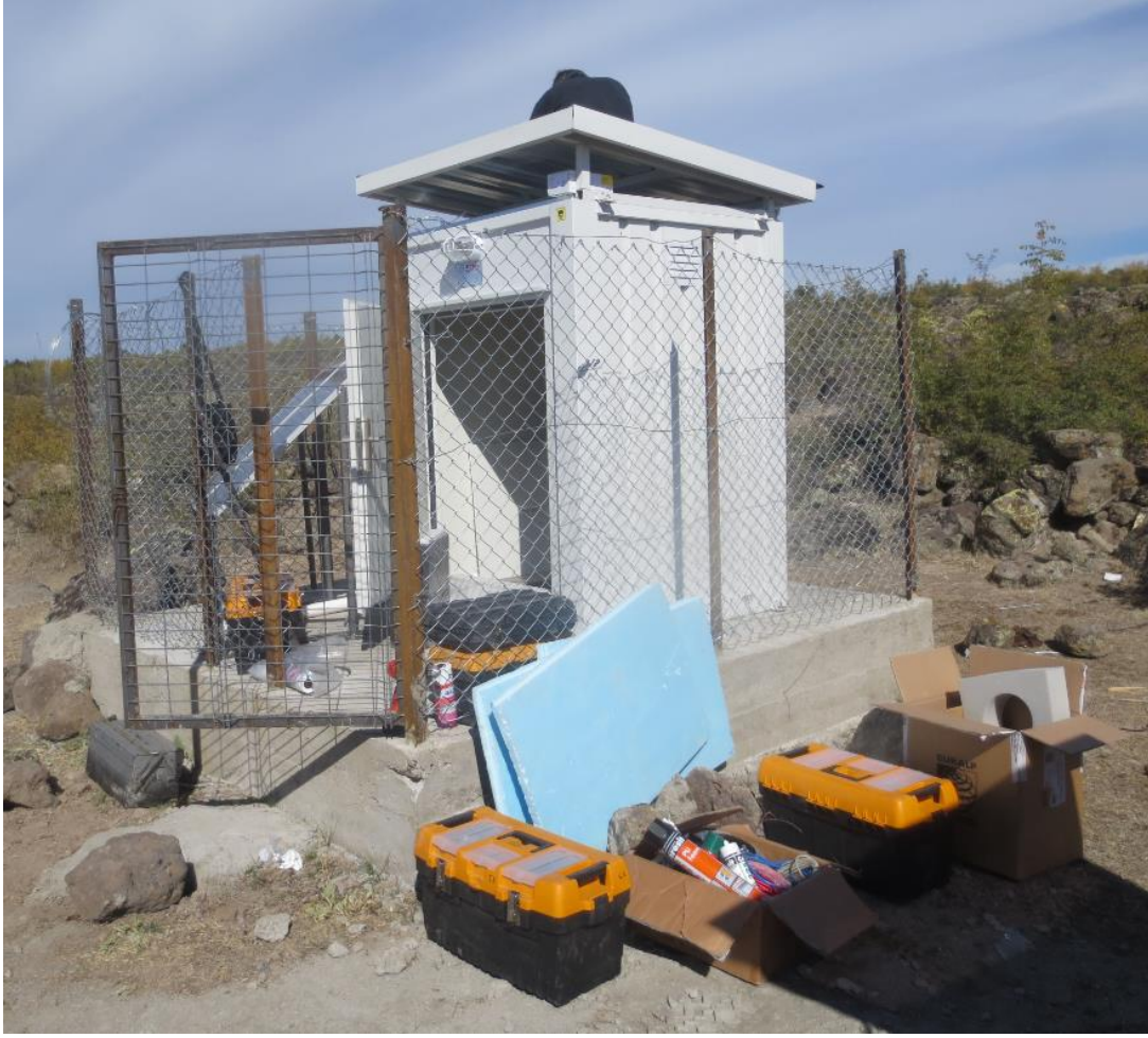
3 x 3 m'2 lik beton zemin hazırlandı, Konteyner montajı yapıldı