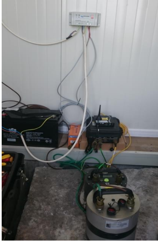
EAM, GPRS Modem v e Akü montajı yapıldı.