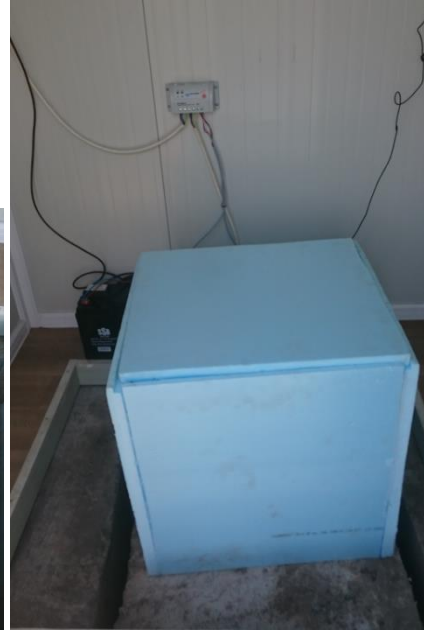
Sismometrelerin ısı yalıtımları yapıldı