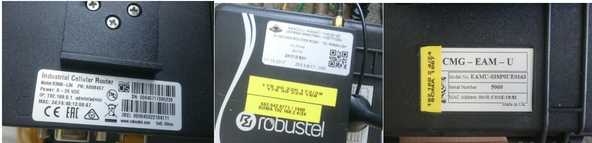
GPRS Modem ve EAM ünitesi S/N - İMEİ bilgileri