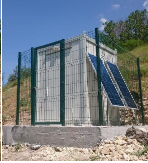
Güneş Paneli ve GPS anten montajı yapıldı