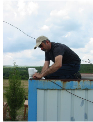
Zaman sinyali almak için GPS anteni çatıya monte edilmiřtir.