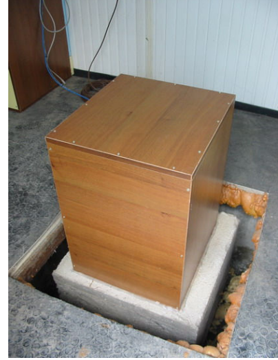
Sismometre, pilyesine yerleřtirildikten sonra baęlantıları ve izolasyonu yapılmıřtır.