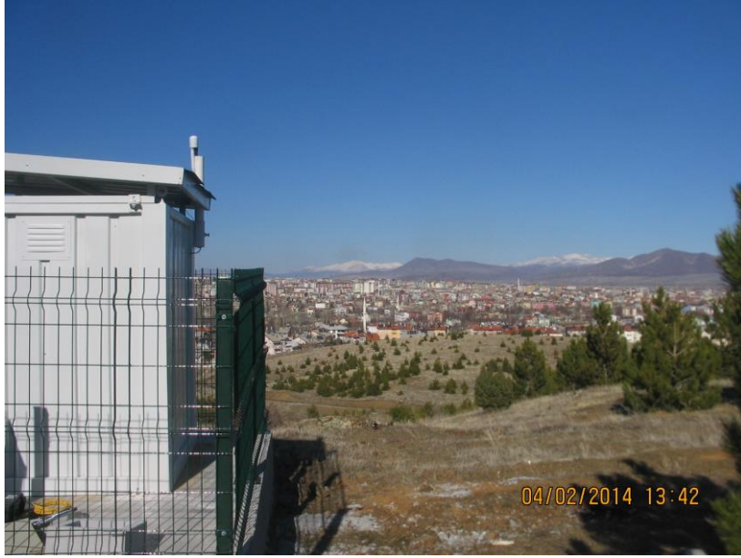
GPS Anteni montajı yapıldı