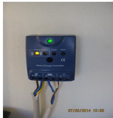
Sismometreler, akü, güneş regülatörü ve EAM montajı yapıldı