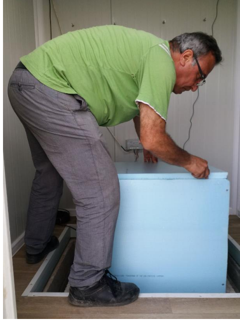
Sismometrelerin ısı yalıtımları yapıldı