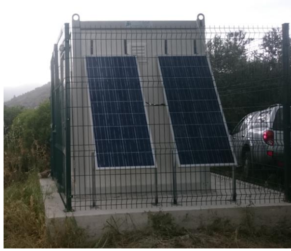
Güneş Paneli ve GPS anten montajı yapıldı