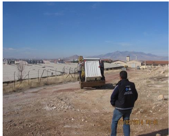
Konteyner taşınarak montaj işlemi yapıldı