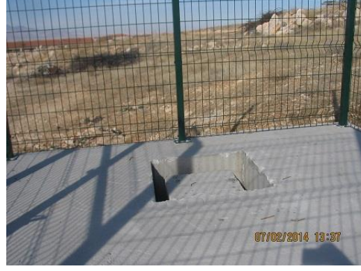
Konteyner sismometre pilyesi üzerine montaj edildi.