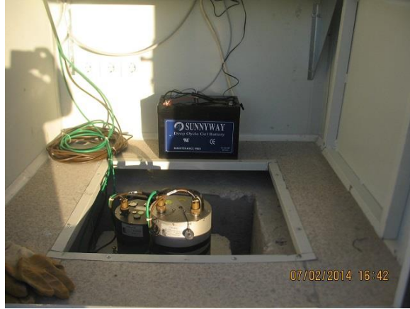
GPS anteni, sismometreler akü regülatör ve EAM montajı yapıldı