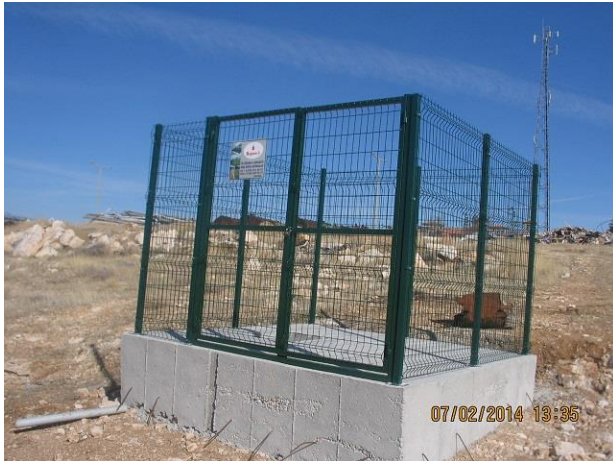
3 x 3 m 2 lik beton zemin hazırlandı