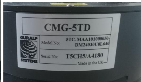
Sismometreler ( Short P ve ivme Ölçer )