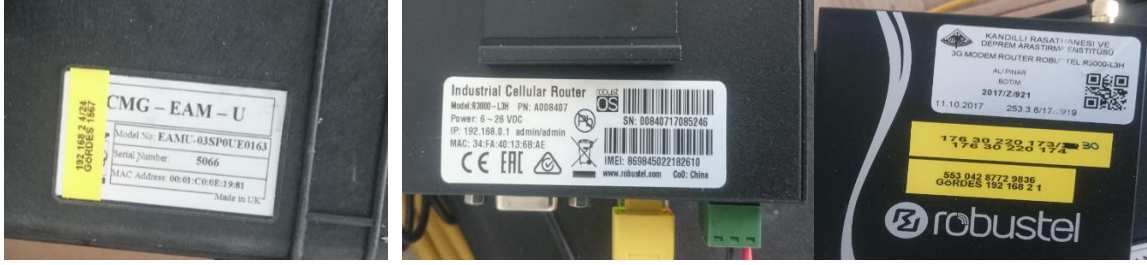
GPRS Modem ve EAM ünitesi S/N - İMEİ bilgileri