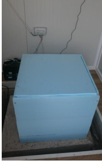
Sismometrelerin ısı yalıtımları yapıldı