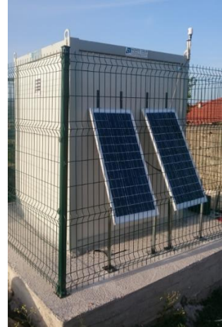
Güneş Paneli ve GPS anten montajı yapıldı