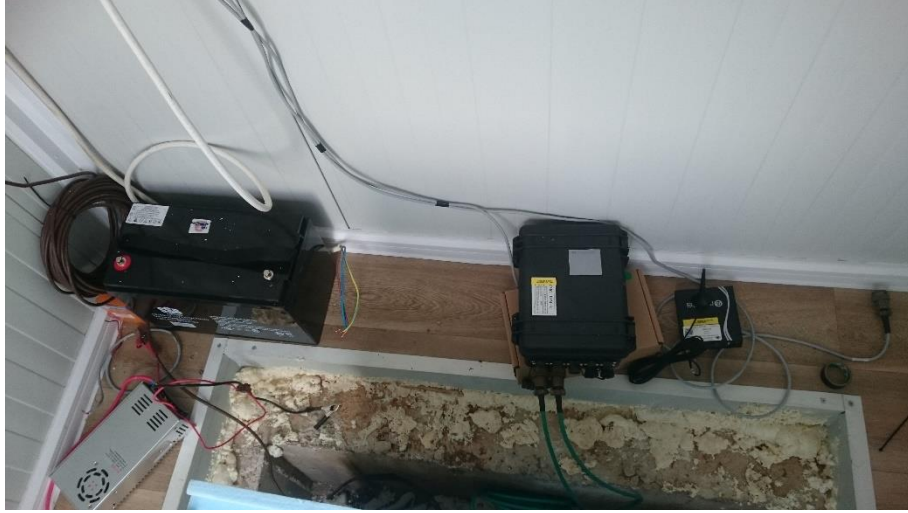
EAM, GPRS Modem ve Akü montajı yapıldı.