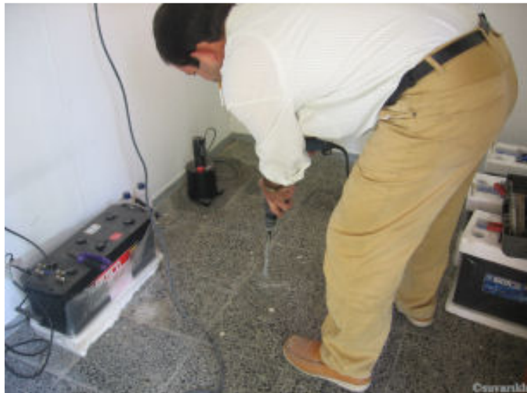
Simometrenin konulacağı zemin hazırlandı.