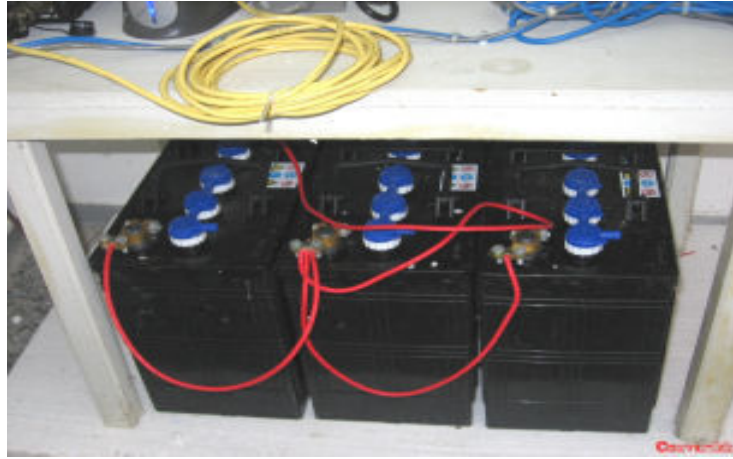
Aküler ile sistemin çalışmasında gerekli olan ekipmanlar bina içerisine monte edilerek bağlantıları yapılmıştır.