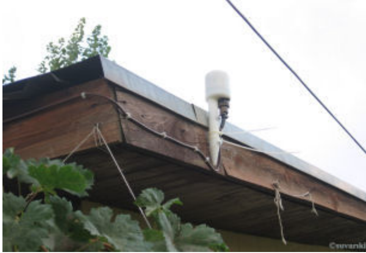
Zaman sinyali almak için GPS anteni çatıya monte edilmiştir.