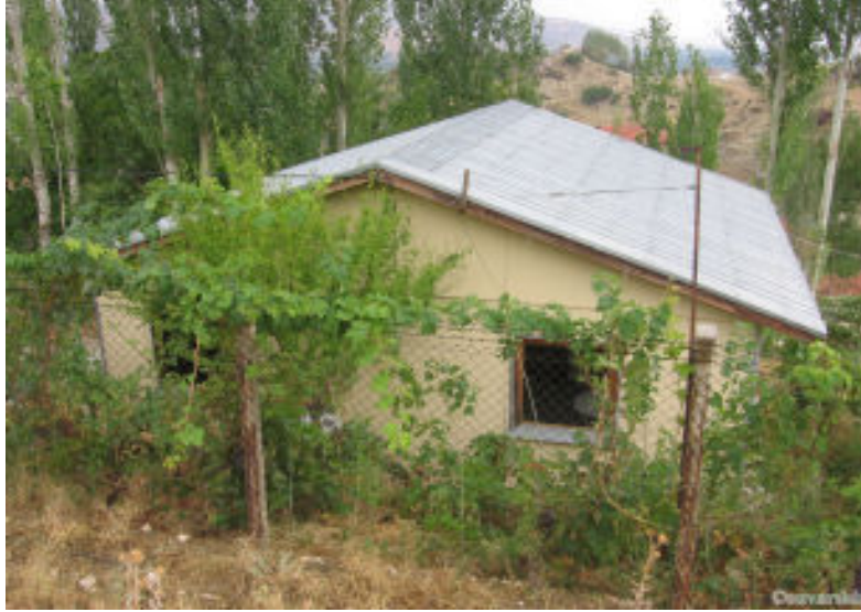
Deprem istasyonu olarak kullanılan bina.