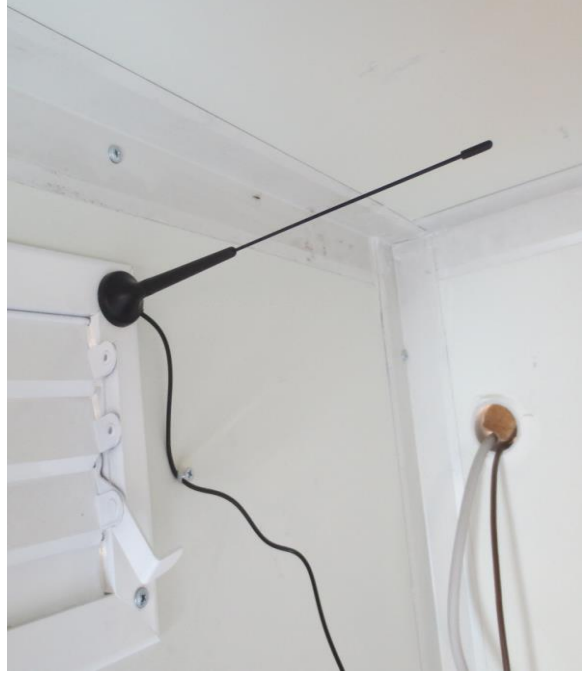
GPS ve GPRS anten montajı yapıldı