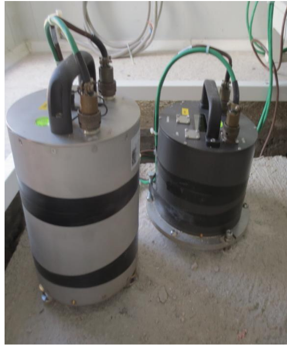
EAM Modülü ve sismometre ler yerleştirildi