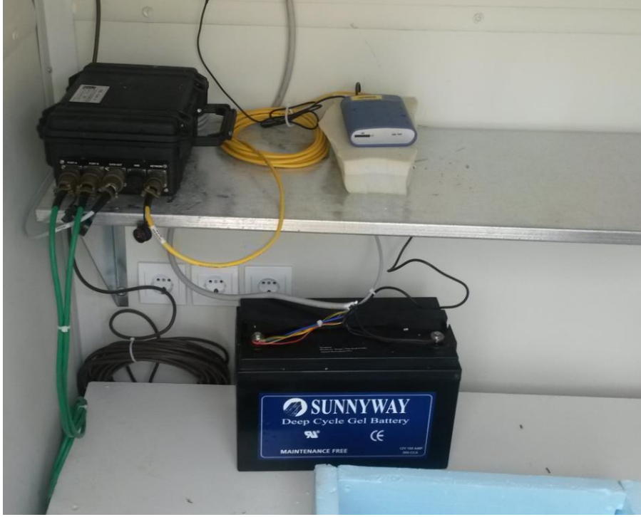
Modem, EAM Modülü ve Akü montajı yapıldı