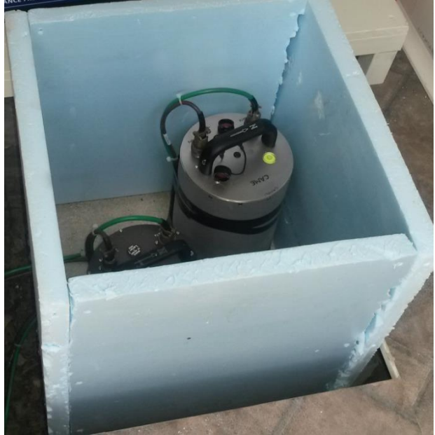
Sismometreler montaj yapılarak izolasyon yapıldı.