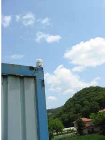
Zaman sinyali almak için GPS anteni çatıya monte edilmiştir.