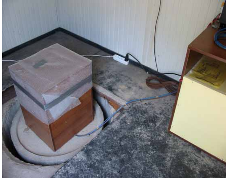
Aküler ile sistemin çalışmasında gerekli olan ekipmanlar bina içerisine monte edilerek bağlantıları yapılmıştır.