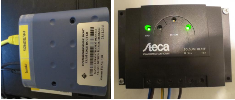
GPRS Modem ve Güneş Regülatörü montajı yapıldı